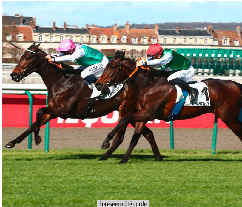
Foreseen côté corde