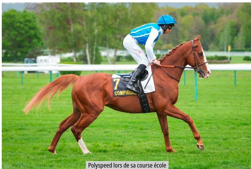
Polyspeed lors de sa course école