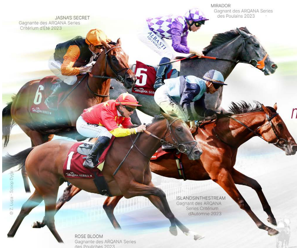
JASNA'S SECRET Gagnante des ARQANA Series Critérium d'Été 2023