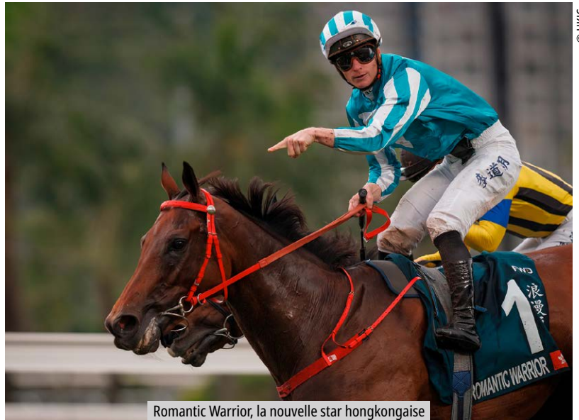
Romantic Warrior, la nouvelle star hongkongaise