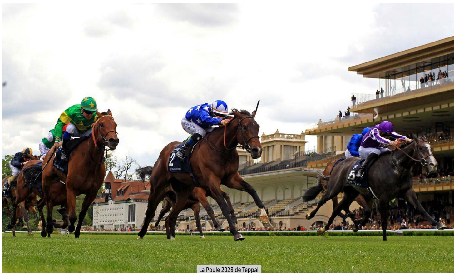
La Poule 2028 de Teppal