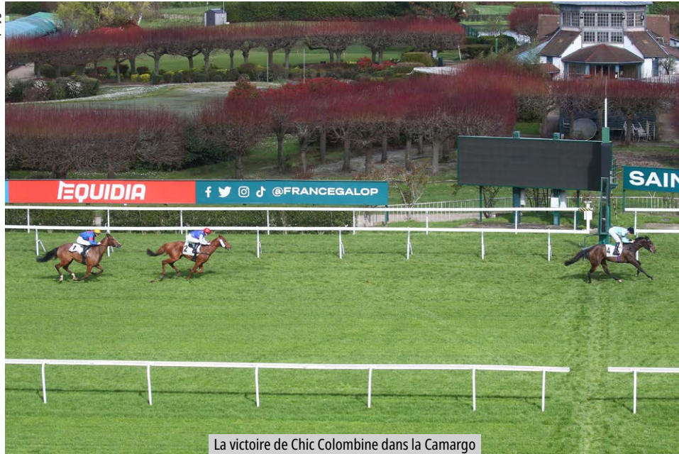
La victoire de Chic Colombine dans la Camargo