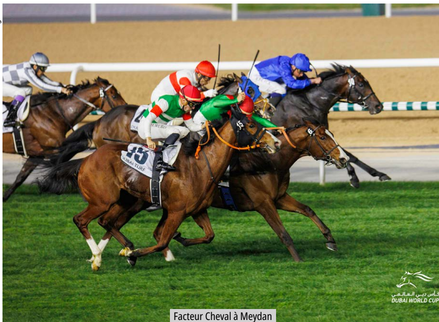
Facteur Cheval à Meydan

niveau en dehors de nos frontières. Après ces années de souffrance, il faut d'autant plus apprécier le regain de compétitivité des chevaux français. Ce retour en grâce semble vouloir se poursuivre. Depuis le début de l'année, la France a accueilli 48 courses black types en plat. Seulement cinq ont été remportées par des chevaux étrangers ! Jeudi soir, la Fédération interna-