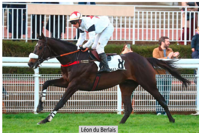
Léon du Berlais

Malchanceux en début de parcours dans le Prix Amadou (Gr2), après avoir enlevé le Prix d'Indy (Gr3), Léon du Berlais (Authorized) est l'attraction du Prix Alain du Breil (Gr1), dans lequel il affrontera plusieurs 4ans de grande classe comme Kingland ★ (Cokoriko), vainqueur du Prix de Pépinvast (Gr3), Kibboutz ★ (Spanish Moon), lauréat du Prix Amadou, King Conti ★ (Pastorius), gagnant du Prix Virelan (L), Dazodream ★ (Doha Dream) ou encore Bon Garçon ★ (Masterstroke), déjà trois fois sur un podium de Gr3. La course promet d'être belle et passionnante !