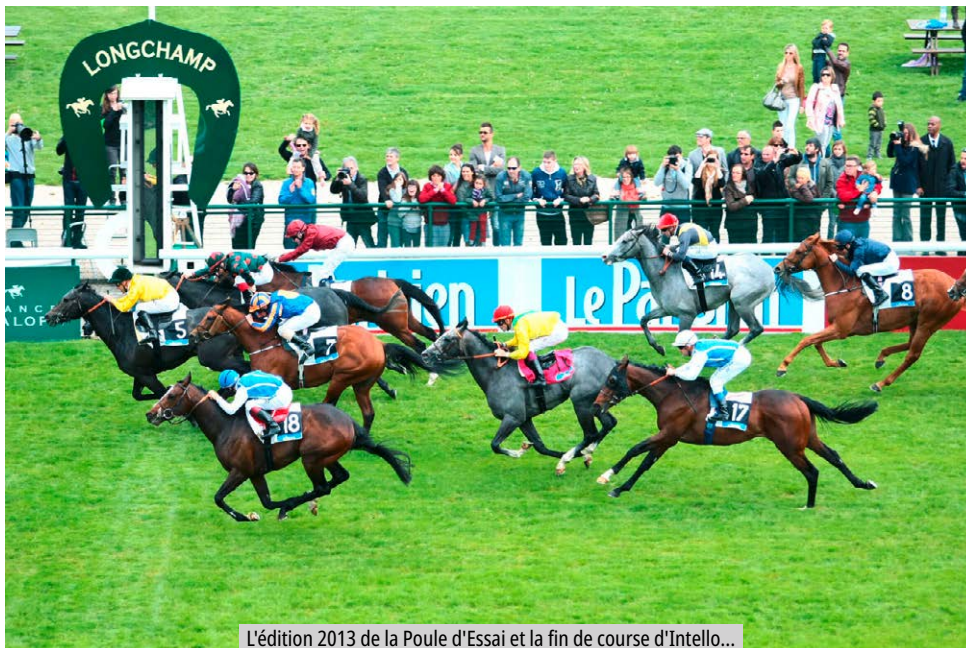
L'édition 2013 de la Poule d'Essai et la fin de course d'Intello...