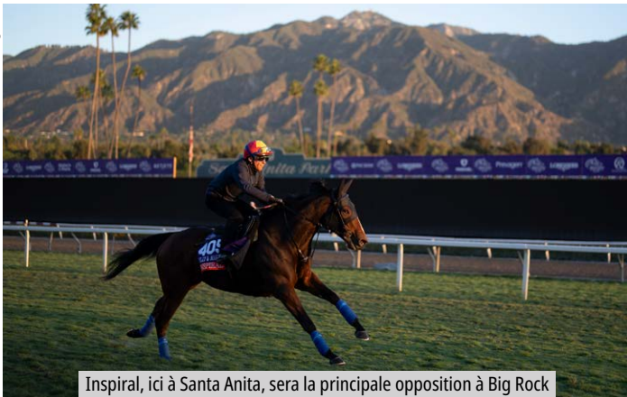
Inspiral, ici à Santa Anita, sera la principale opposition à Big Rock

C'est jeudi matin, lors de son départ pour Newbury, que la mission anglaise de Big Rock (Rock of Gibraltar) a débuté. Dans 72 heures, l'élève de Yeguada Centurion va en effet croiser le fer avec Inspiral (Frankel) dans les Lockinge